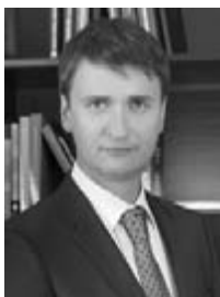
Ю.М. Лермонтов государственный советник Российской Федерации 3-го класса