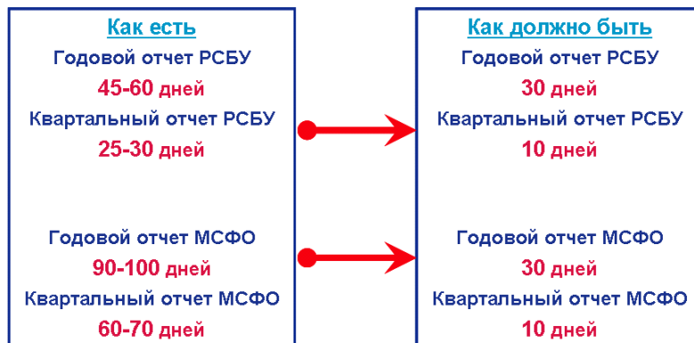
Рис. 1. Целевые сроки подготовки отчетности

финансовой отчетности, рассматриваемые в качестве стратегической цели проекта fact close , приведены на рис. 1.