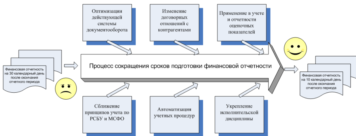
Рис. 3. Комплексный подход к решению задачи по сокращению сроков подготовки отчетности

Таким образом, сокращение сроков подготовки финансовой отчетности является задачей, охватывающей все бизнес-процессы, происходящие в компании, и предполагает комплексный подход к решению, основные направления которого приведены на рис. 3.